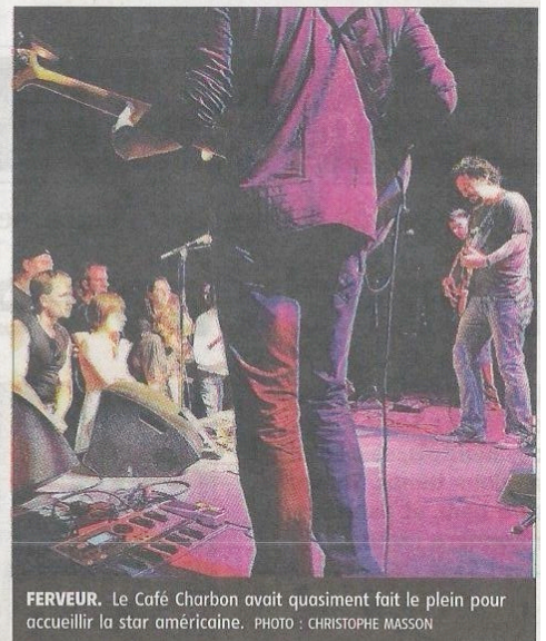
FERVEUR. Le Café Charbon avait quasiment fait le plein pour accueillir la star américaine.